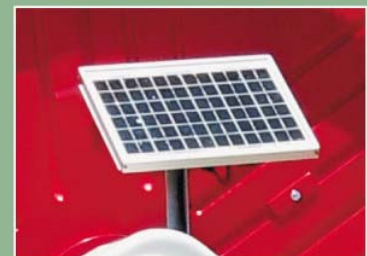
Placa Solar para recarga de bateria