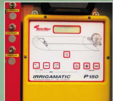
Painel eletrônico de controle de velocidade